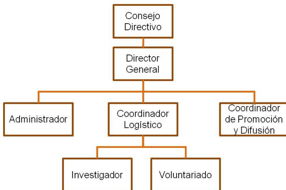
Gráfico Nº 3 Organigrama Asociación Civil MUSICALIA

La participación de las agrupaciones musicales, músicos, estudiantes universitarios de música, maestros de las escuelas, padres y representantes se mantiene como hasta el momento, en calidad de voluntarios, bajo la responsabilidad del Coordinador Logístico.